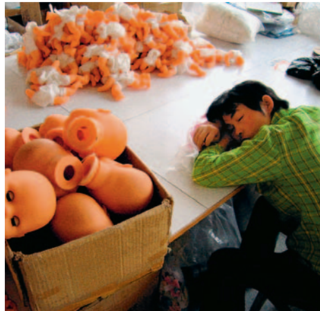
Sozialklauseln in Handelsverträgen bringen in der informellen Wirtschaft kaum Verbesserungen.

Heute taucht die Diskussion über die Sozialklausel im Rahmen der bilateralen Freihandelsabkommen wieder auf. In der